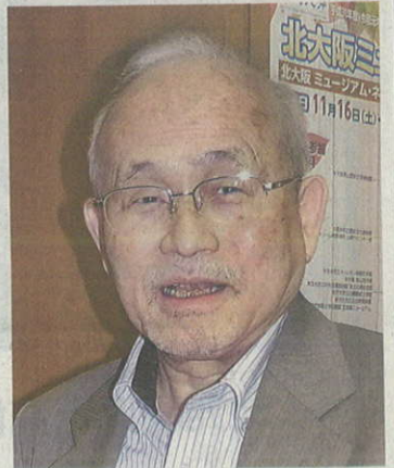
知の巨人、梅棹忠夫さんの構想メモを解説し、

比較文明論から情報論まで、幅広い領域で独創的な仕事を残した梅棹忠夫さん(1920〜2010年)。 この知の巨人が著作のために作り半世紀近く埋もれていた構想メモを読み解き、「梅棹忠夫の『日本人の宗